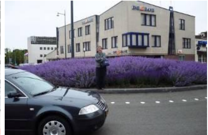
Na – 2