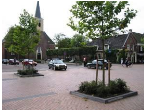
Na – 1