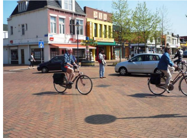
Plein: geen verschil tussen stoep en rijbaan