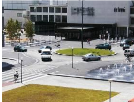
Na – 1