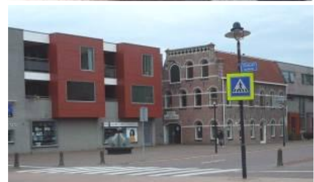
Na – 2